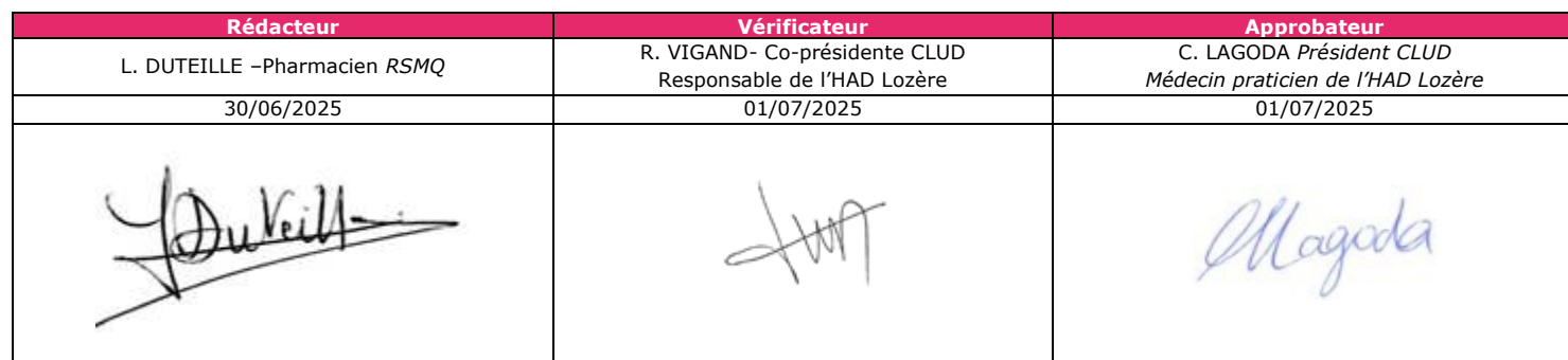
Tableau de validation